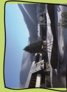
Centre d'altitude de la Charente

De part la proximité avec le Parc National des Pyrénées et la réserve du Néouvielle , la situation du centre est propice à la mise en place de projets autour de l'environnement, la découverte de la nature.